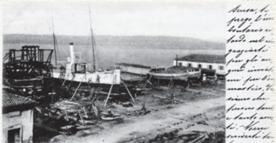
Un saluto di Copodistria. Cartier Poli, 1895