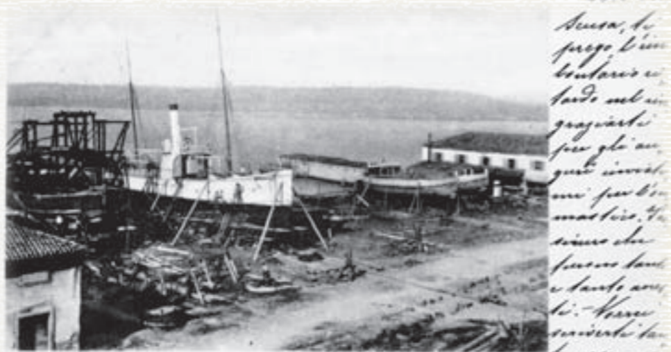
Un saluto di Copodistria. Cantieri Poli, l'ingoglio de la... ...la p. v. dell'istima... ...di famiglia... ...stabilimento... ...qualità...