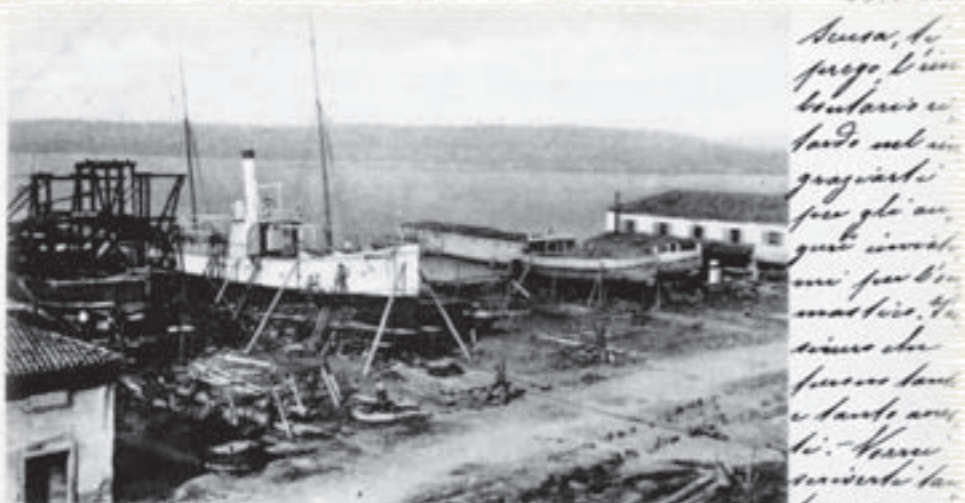
Un saluto di Copodistria. Cantieri Poli. Alcuna, di frago l'inn bentato e bando nel graziosi per gli an quasi in uni per b matto. U siano che fanno b e bando bi. Ho suscitato la loro, un inoglio le l'ora. Se non triste e si alle b della b della b